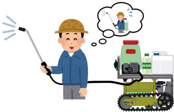
追従して液剤散布