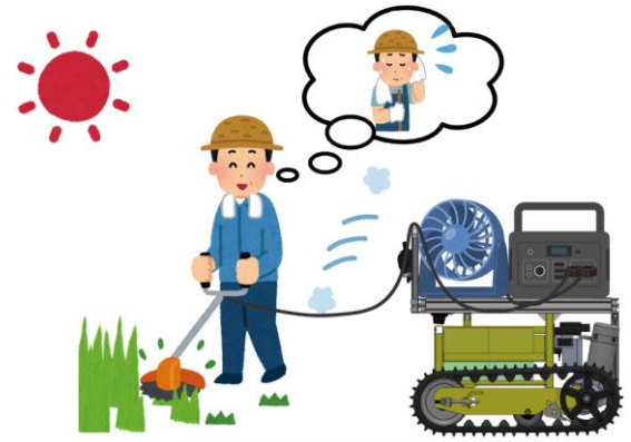
追従して除草作業