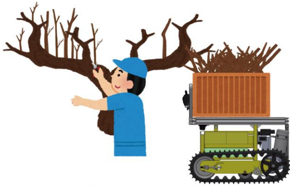
追従して剪定作業