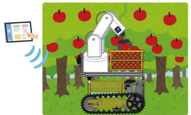
遠隔操縦による収穫