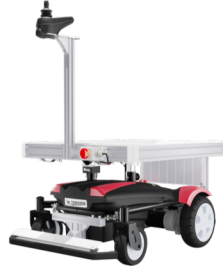
サウザースタンダード